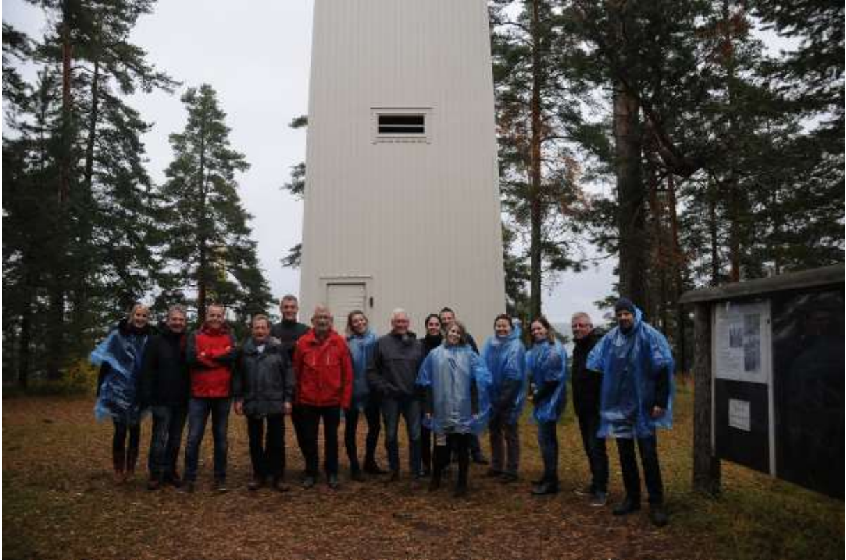
De EU-regio op bezoek in Finland “Strategien zur Verringerung von Drop-Outs”